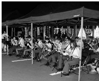
7月19日(金)・8月2日(金)～8月11日(日) 「あかすなみずベテラスinサマー」