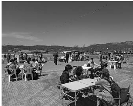
4月13日(土) 「あかすなみずベテラス第1弾」