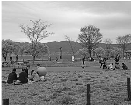
4月21日(日) 「あかすなみずベテラス第2弾」